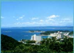
平草原からの眺め