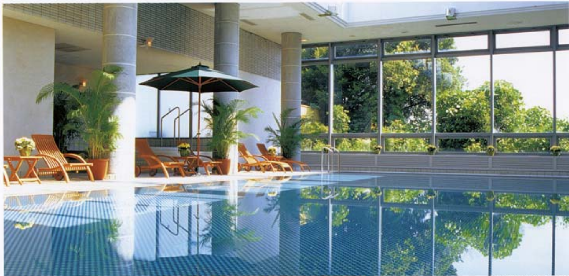
室内プール (1年中ご利用いただけます)