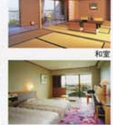
ファミリールーム