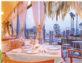
レストラン&ビュッフェ「コンゴドー」

レストラン「コンゴドー」はギリシャ語で「金色の貝殻」を意味します。南フランスの素材の持ち味を生かした料理が中心で、地中海風のテイストを存分に楽しみたいいただけます。