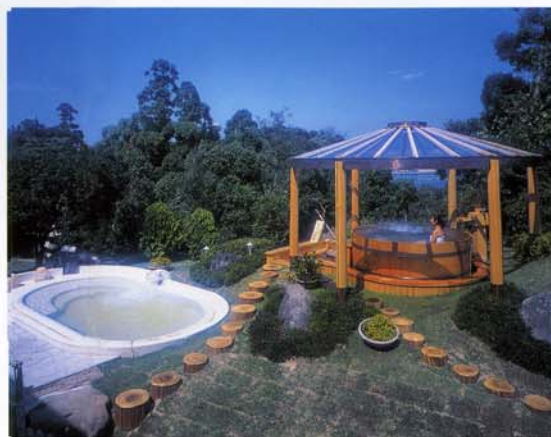
海が見える大自然の湯

南紀白浜の海が一望できる高野嶺を使用した開放感いっぱいの露天風呂です。花と自然を満喫できる、ベイホテルならではの施設で、皆様にご満足いただいています。