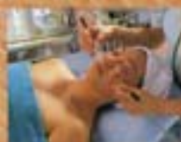
エステティックサロン

四季を通じて豊かな自然の恵みを取り入れ、ここに足を一歩踏み入れたなら、ひと味違う上質な白浜を堪能できるコガノイベイホテル。スペースのあちこちに花咲き誇る癒しのリゾートです。